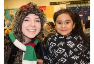
Holiday Fun with our friends from Christ Church! ¡Diversión del día festivo con nuestros amigos de Christ Church!