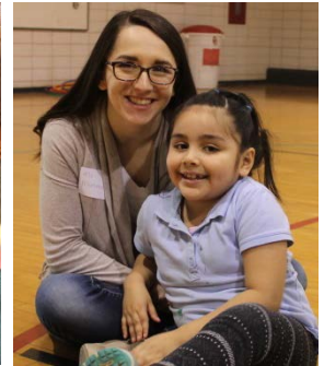
The After School Enrichment Program students had so much fun meeting a real life armadillo!